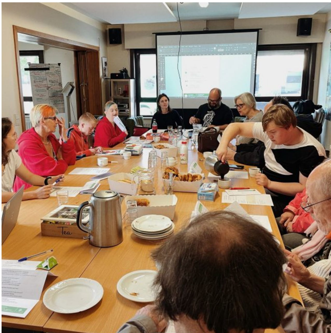
's Middags werden de zware inspanningen beloont met een gezellige lunch.