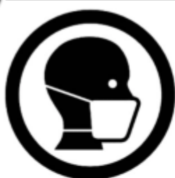
Hoe bescherm je jezelf?