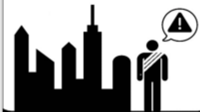
extra regels per gemeente

www.praatplaat.be is een spraakwebsite voor mensen met een verstandelijke beperking van Den Dries vzw.