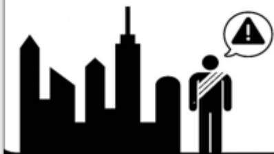
extra regels per gemeente

www.praatplaat.be is een spraakwebsite voor mensen met een verstandelijke beperking van Den Dries vzw.