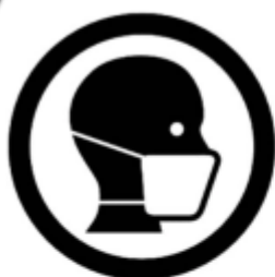
Hoe bescherm je jezelf?