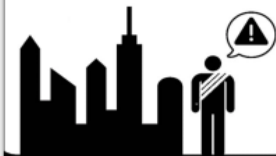
extra regels per gemeente

www.praatplaat.be is een spraakwebsite voor mensen met een verstandelijke beperking van Den Dries vzw.